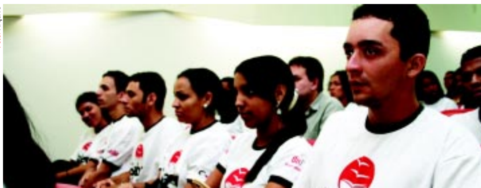
CURSO – Aulas abordam temas como boas práticas de fabricação e cidadania