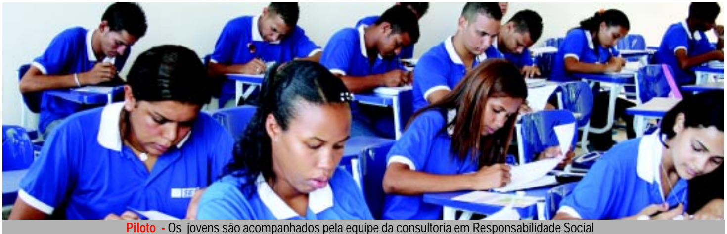
Piloto - Os jovens são acompanhados pela equipe da consultoria em Responsabilidade Social